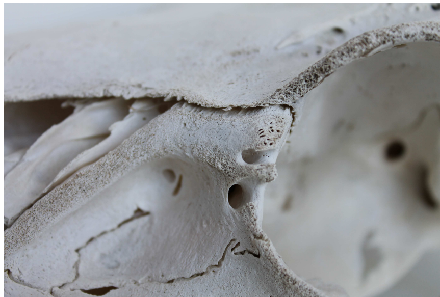
Zerstörte Knochenoberfläche eines mit Natronlauge entfetteten Schädels