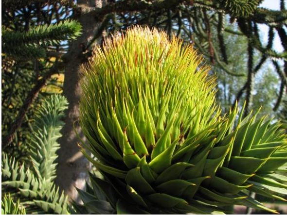
Abb. 8: Araucaria araucana , junger Samenzapfen in aufrechter Position;

nur eine Samenanlage . Die aufrechten Samenzapfen stehen subterminal an kurzen seitlichen Trieben. Ein für viele Koniferen typischer Bestäubungstropfen wird nicht ausgebildet, dafür ist der Nucellus narbenartig gestaltet. Zum Zeitpunkt der Samenreife zerfallen die Zapfen, nur die Zapfenspindel bleibt am Baum erhalten, wie dies z.B. auch bei den Pinaceae-Gattungen Abies und Cedrus der Fall ist.