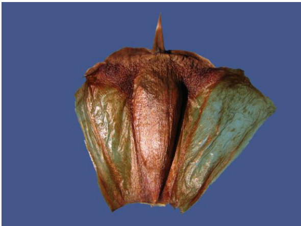
Abb. 10: Araucaria bidwillii , Same mit deutlichem pergamentartigen Flügel;

Die Samen sind entweder ungeflügelt oder weisen einen kleinen Samenflügel auf. Beim Großteil der Araucarien sind Same und Zapfenschuppe teilweise bis vollständig miteinander verwachsen. Lediglich bei Araucaria bidwillii (Sektion Bunya) werden geflügelte Samen ausgebildet, wie dies auch bei Agathis und Wollemia der Fall ist.