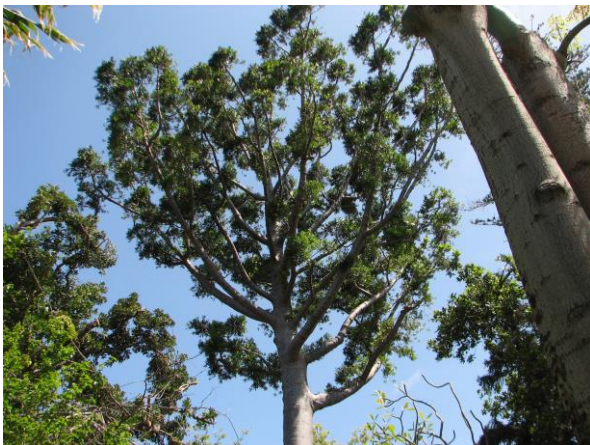
Abb. 2: Agathis dammara , Habitus;

Araucariaceae sind ausschließlich große, ausladende, immergrüne Bäume mit besonders in der Jugend sparriger Verzweigung. Viele Arten haben im Alter eine hochgewölbte Krone. Die Hoftüpfel im Holz haben eine charakteristische bienenwabenartige Gestalt (araukaroide Tüpfelung).