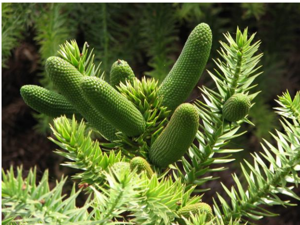
Abb. 6: Araucaria angustifolia , unreife Pollenzapfen;

Der überwiegende Teil der Araucariaceae ist diözisch , es gibt also rein männliche und rein weibliche Individuen. Lediglich bei Araucaria -Arten aus der Sektion Araucaria kommen auch vereinzelt monözische Individuen vor. Die männlichen Pollenzapfen haben zum Zeitpunkt der Pollenreife eine stark verlängerte Zapfenspindel, um den Pollen besser entlassen zu können. Die Pollenzapfen stehen im jungen Stadium aufrecht, hängen dann mit zunehmender Pollenreife schlaff über. Die männlichen Sporangioophore tragen artspezifisch zwischen 4 und 20 Pollensäcke.