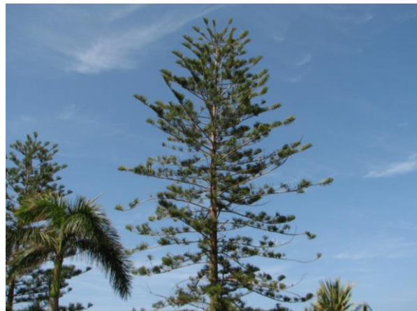
Abb. 3: Araucaria heterophylla , Habitus;