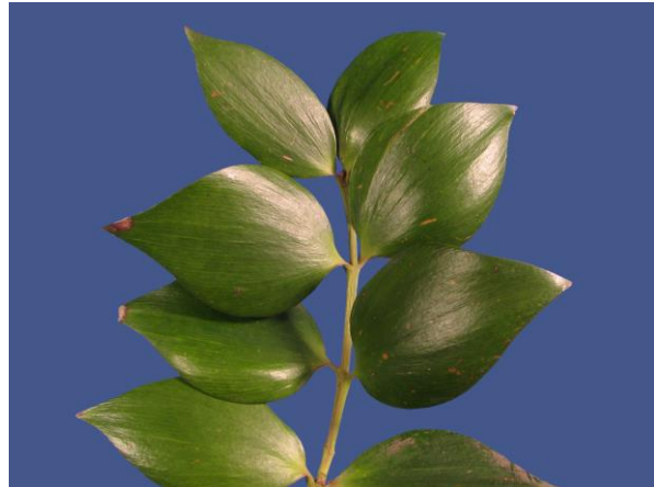
Abb. 5: Agathis dammara , Flächenblätter;