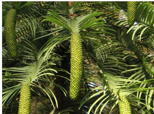
Abb. 7: Wollemia nobilis , reife Pollenzapfen;

Die Samenzapfen der Araucariaceen sind Holzzapfen , die sich je nach Art aus wenigen bis zu mehreren hundert Deck-/Samenschuppen-Komplexen aufbauen (z.B. Araucaria araucana ). Die Deck- und Samenschuppe sind eng miteinander zu einer gemeinsamen Schuppe verwachsen. Jede dieser Zapfenschuppe trägt jeweils