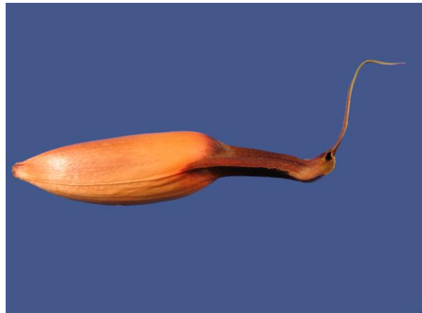
Abb. 11: Araucaria araucana , Same und Zapfenschuppe sind stark miteinander verwachsen;