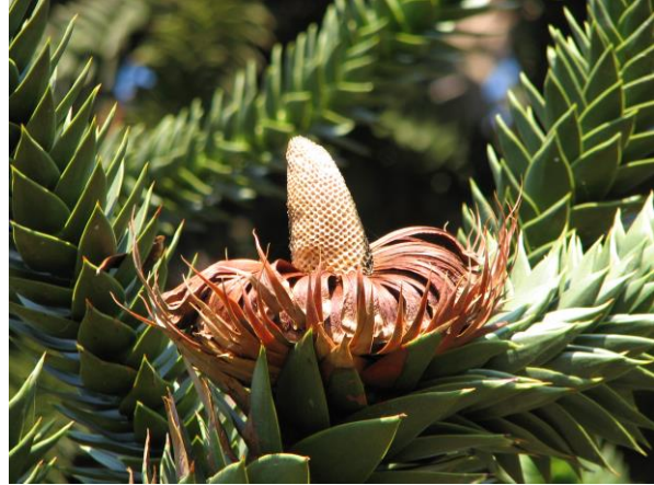
Abb. 9: Araucaria araucana , nach dem Zerfallen des Zapfens bleibt nur die Zapfenspindel erhalten;

Die Samen sind entweder ungeflügelt oder weisen einen kleinen Samenflügel auf. Beim Großteil der Araucarien sind Same und Zapfenschuppe teilweise bis vollständig miteinander verwachsen. Lediglich bei Araucaria bidwillii (Sektion Bunya) werden geflügelte Samen ausgebildet, wie dies auch bei Agathis und Wollemia der Fall ist.