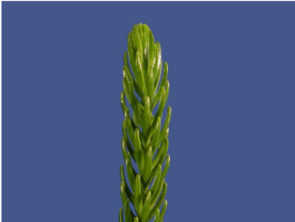
Abb. 4: Araucaria heterophylla , Nadelblätter;

Altersblätter, aber eine echte Altersheterophyllie wie bei zahlreichen Araukarien liegt in dieser Gruppe nicht vor.