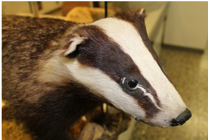
Dachspräparat ( Meles meles ) mit Bruchstelle vor dem Auge